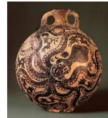
(vaso minoico a forma di polpo 3000 a.C. Museo archeologico di Heraklion - Grecia).

In verità non so. Sotto i mari, non facciamo queste distinzioni, cosa vuoi...siamo più di 300 specie Octopus diverse per dimensioni e colori. Io sono il più comune.... certo è che da sempre sono anche il più considerato e famoso, non peraltro sono ritratto fin dai tempi antichi....guarda questo vaso...tutto dedicato a me